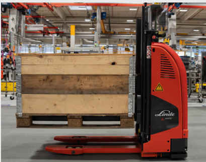
Präzises und sicheres Handling