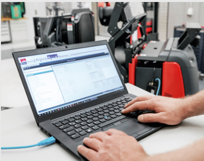
Effizienter und schneller Service