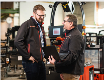
Prozessfokus als Standard